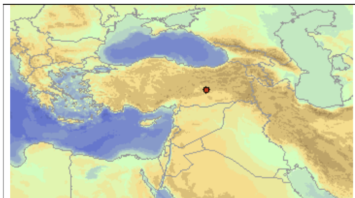
Distribución de Aphanius asquamatus Mapa © KGSMapper

Hábitat y Distribución: Lago Hazer ("Hazar" como variante), Turquía. Coordenadas aproximadas: Long: E39° 17'; Lat: N38° 27'