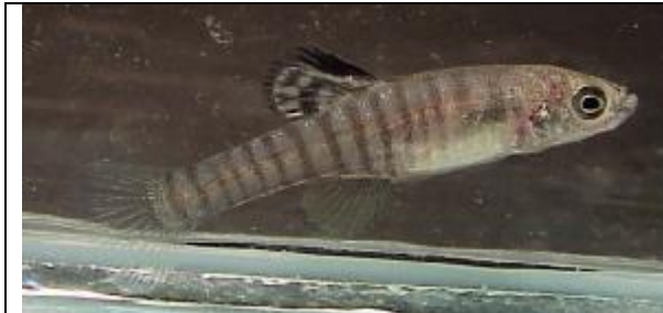
Aphanius asquamatus , macho. "Hazar Golu".

Nombres comunes: Inglés: Hazar killifish, Scaleless killifish; alemán: Nacktschuppenkärpfling.