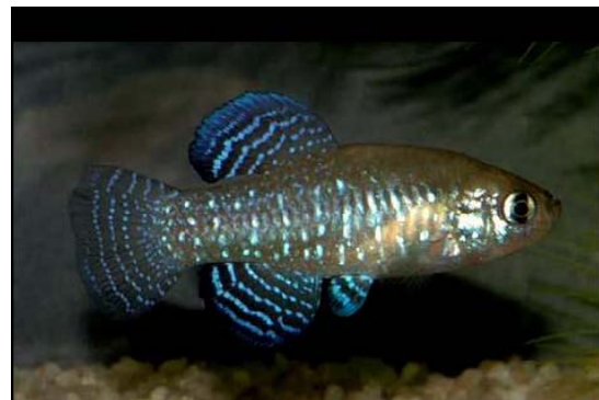
Aphanius danfordii (izda) y Aphanius mento (derecha). Son dos especies amenazadas de Turquía