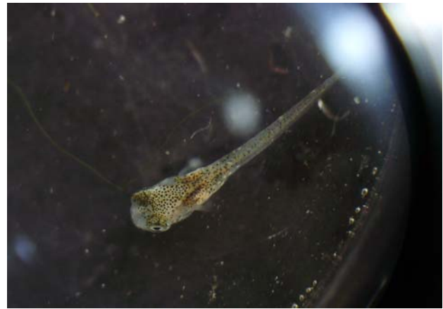
Huevo y alevín de Aphanius anatoliae . Ejemplo de lo que vemos en el laboratorio del colegio con los alumnos.